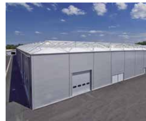
Parc Expo Tours (37)