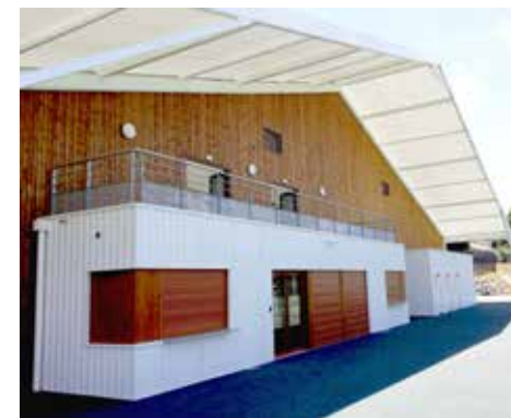
Tennis Club de Saint Pierre de Mont (40)