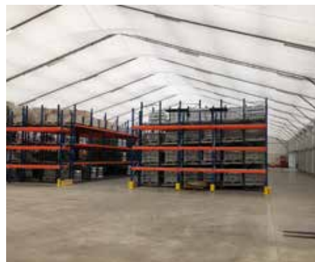
Atelier municipal, Sarreguemines (57)