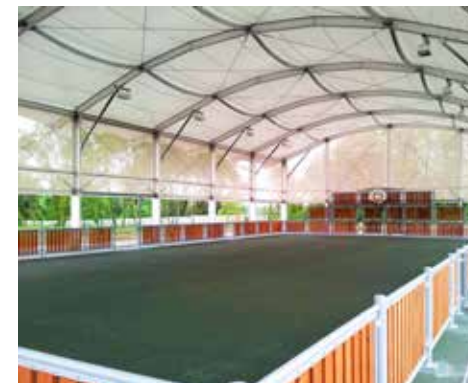
Préau multisport Saints (77)