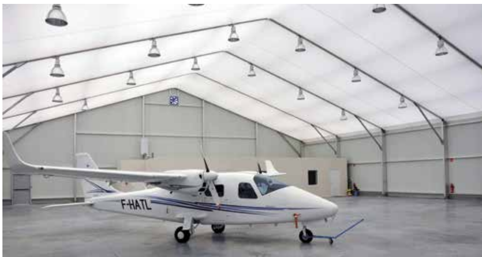
Aérodrome de Bourg en Bresse (01)