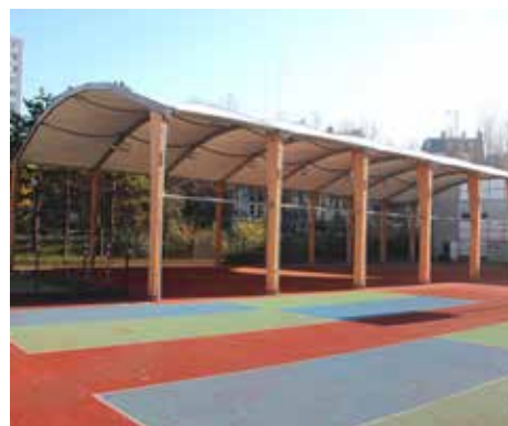
Collège Léon Mottot, Paris (75)