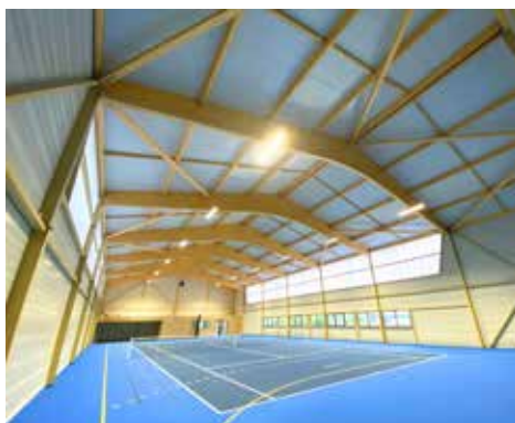
Tennis Club de Castres sur-Gironde (33)