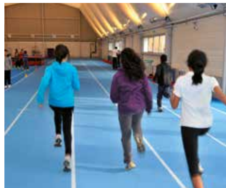
Halle d'athlétisme Aulnay Sous Bois (93)