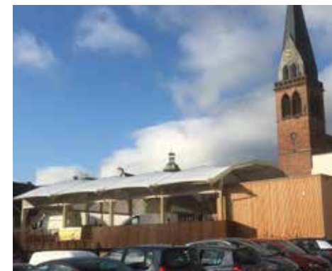
Marché couvert, Ingwiller (67)