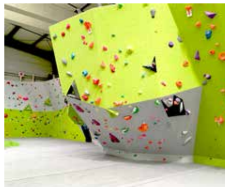
Salle d'escalade de Colmar (68)