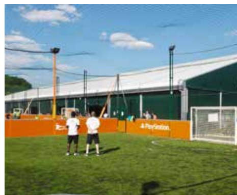
Urban Football Guyancourt (78)